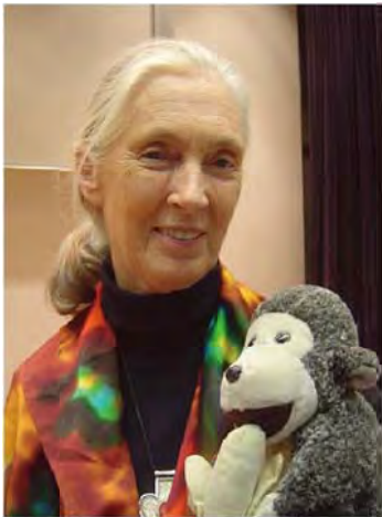
珍·古德 Dame Jane Goodall 又名珍·范羅伊·克·古德

1934年4月3日生(79歲) 英國生物學家、動物行為學家 和著名動物保育人士。